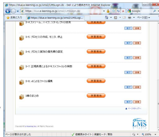
学習管理システム